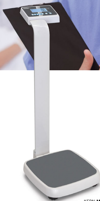
KERN MPE-PM mit Stativ