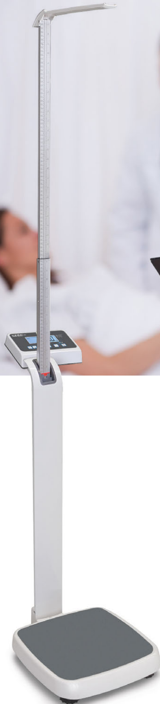
KERN MPE-HM mit Stativ und Größenmessstab